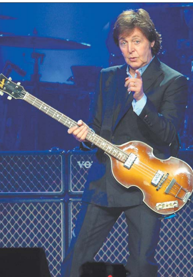
Paul McCartney singt einen Hit nach dem anderen und saugt die Atmosphäre in der Halle auf.

Beim einzigen Deutschland-Konzert gibt der Ex-Beatle drei Stunden lang alles